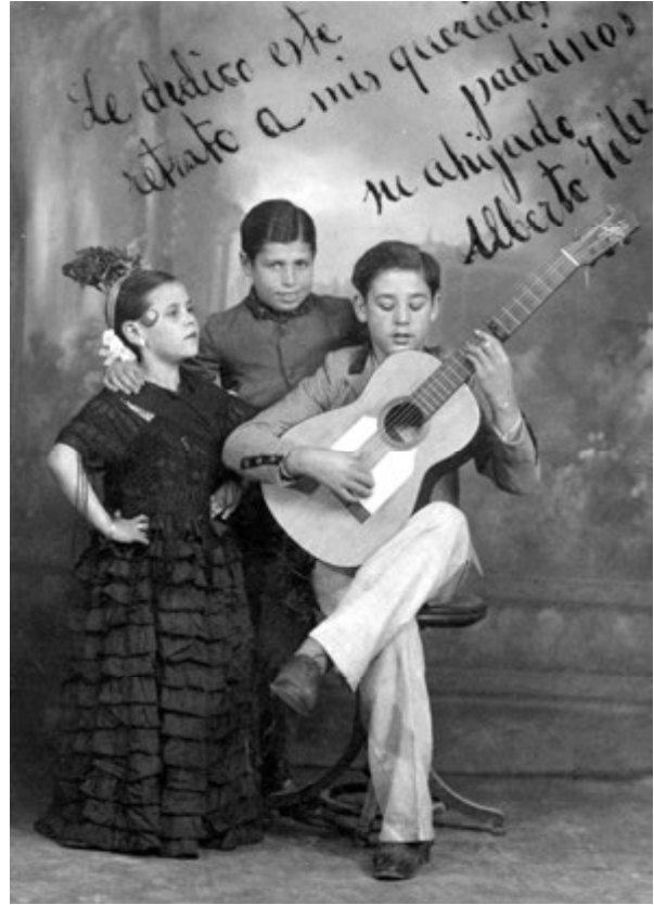
En sus comienzos con "El Trío Huelvano" (Huelva, 1934) At the beginning of his career with the "Trío Huelvano" (Huelva, 1934) Le "Trío Huelvano" à leurs débuts (Huelva, 1934)