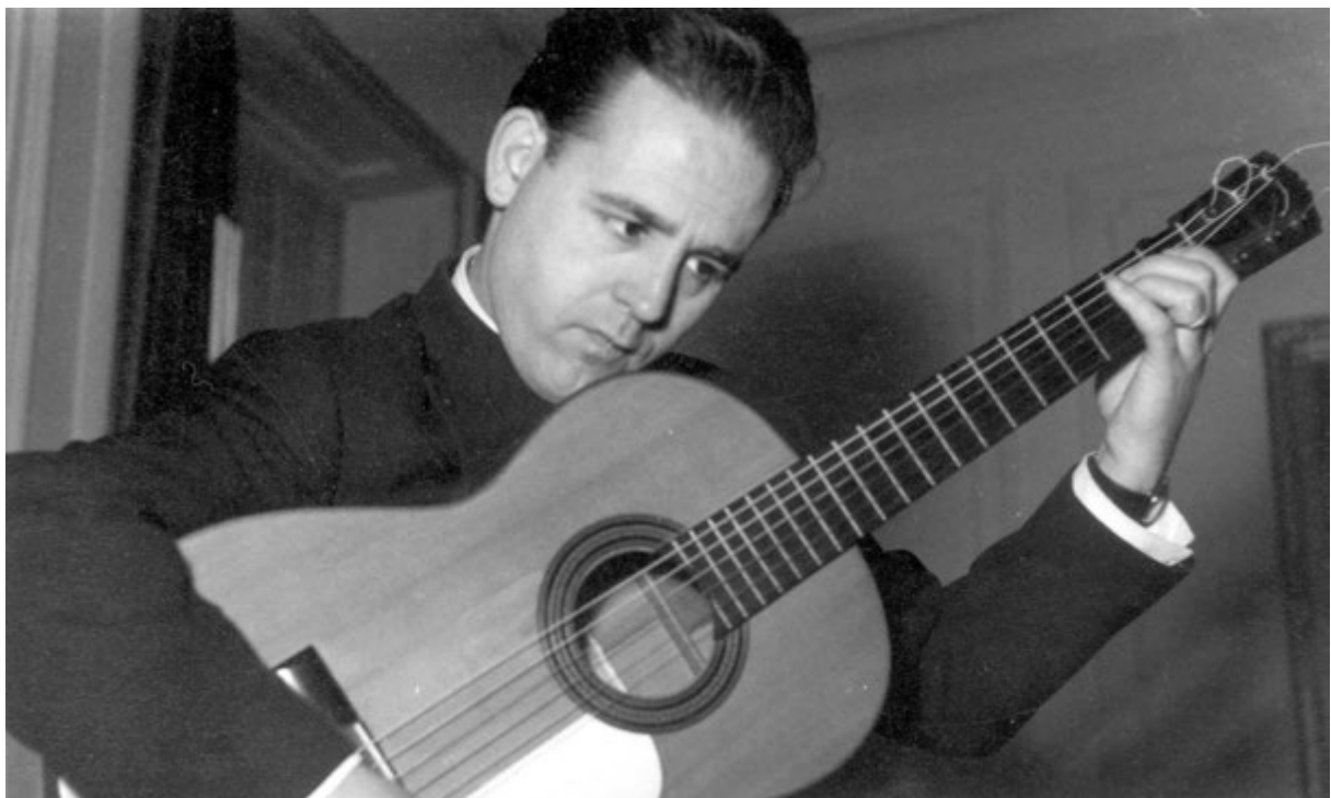
Saliendo a escena en concierto. Caracas, 1953 (Venezuela) Arriving on stage for a concert, Caracas, 1953 (Venezuela) Entrée sur scène, concert de Caracas, 1953 (Venezuela)