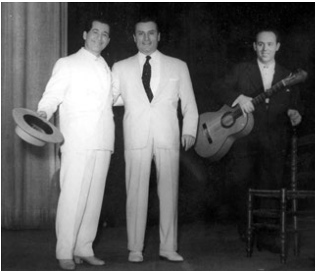
Buenos Aires, 1960 (Argentina) Juanito Valderrama, Angellillo y Alberto Vélez